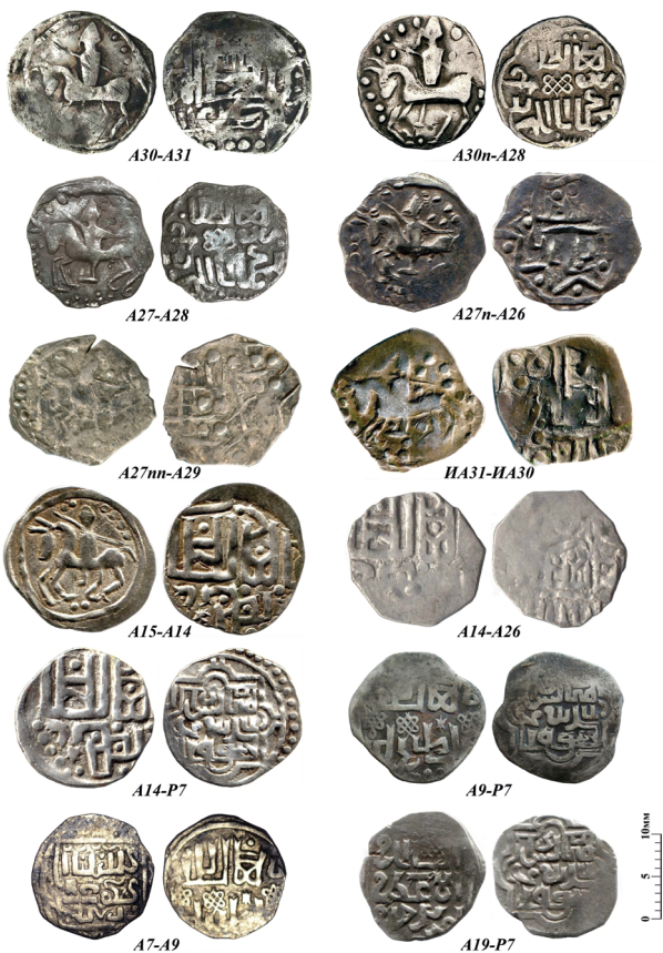
Северские монеты с изображением всадника, отчеканенные с использованием разных штемпелей, и связанные с ними общими штемпелями двусторонние подражания джучидским дангам