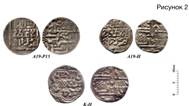
Двусторонние подражания джучидским дангам, имеющие штемпельные связи с северскими монетами с изображением всадника

низации. Соответственно, в Новомосковском кладе могли быть экземпляры, выбитые и после 786 г. х.). Интересующая нас монета была отчеканена на заготовке с ярко выраженными следами обрезки по краям, что придало ей восьмиугольную форму. Фигура всадника – еще более искаженная, оборотная сторона и в этом случае является подражанием аверсам джучидских монет такого же типа (как на монете из Алексинского клада, но значительно грубее). Осенью 2007 г. в Шаблыкинском районе Орловской области, на посаде городища Слободка (летописный городок Болдиж?), была найдена монета, отражающая крайнюю степень деградации рассматриваемого типа (рисунок 1: A27пп-A29). Ее вес составляет 1,28 г, форма – неправильная угловатая, со следами небрежной обрезки. Фигура всадника на лицевой стороне только угадывается, изображение на оборотной стороне выглядит как беспорядочный набор пересекающихся коротких прямых линий и крупных точек.